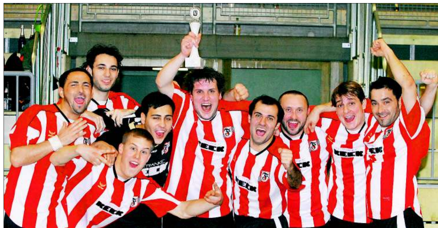
Bezirksligist Sportvg Feuerbach hat im vergangenen Jahr das 27. Hallenfußballturnier des FV Zuffenhausen gewonnen.

Rund zehn Stunden Fußball werden morgen ab 9.45 Uhr in der Talwiesenhalle geboten. Im 13-Minuten-Takt spielen zwei